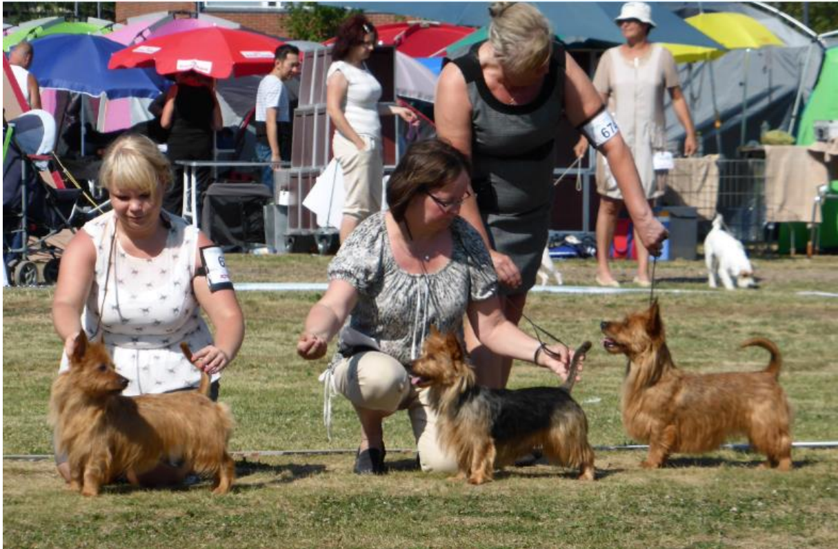
Oben Hündinnen Zwischenklasse, enorm stark besetzt. Ganz rechts zu sehen Hoksel Olympia. Unten Hündinnen Championklasse, Jaskarin Surprise Herself und Melukylän Olan Kohautus.