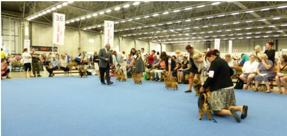
Das deutsche Fachpublikum