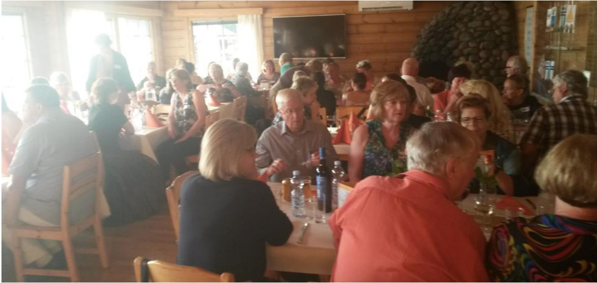
Besonders lecker war die Aussie-Heidelbeertorte zum Dessert, gereicht mit Kaffee und Likör.